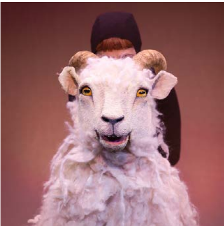
Þokkabót : Tess Rivarola